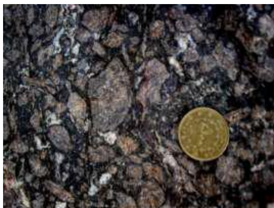
شکل ۲: ساخت مگاپورفیری در تراکی آندزیت