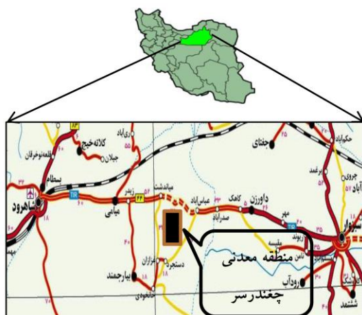
شکل ۱: نقشه راه‌های دسترسی به منطقه [۳۷]

کانسار مس (معدن متروکه) چغندر سر در استان سمنان در منطقه عباس آباد، در ۱۳۵ کیلومتری جاده شاهرود به سبزوار واقع شده است (شکل ۱). منطقه مطالعاتی با وسعت ۲۸ کیلومتر مربع بین عرض‌های جغرافیایی ۱۱' ۱۲' ۵۶° تا ۱۵' ۱۲' ۵۶° شمالی و طول‌های جغرافیایی ۳' ۱۸' ۳۶° تا ۳' ۲۲' ۳۶° شرقی قرار می‌گیرد.