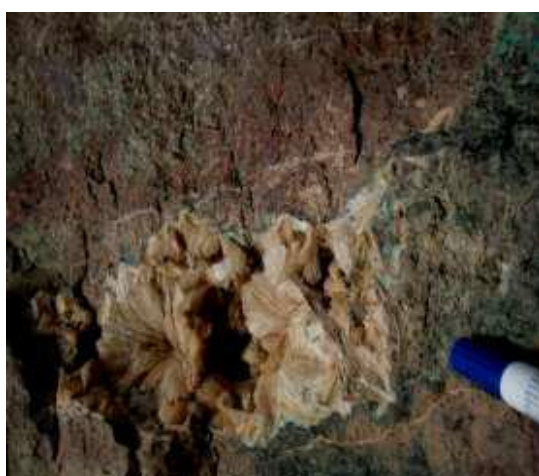
شکل ۳: زئولیت و ملاکیت در تراکی آندزیت

مطالعات زمین شناسی عمومی منطقه نشان می‌دهد که منطقه مورد مطالعه در تقسیم‌بندی ساختاری ایران از نظر آقانباتی (۱۳۸۳) بخشی از نوار آتشفشانی ایران مرکزی را شامل می‌شود که در لبه شمالی زون ایران مرکزی (شرق استان سمنان) قرار دارد. بررسی نقشه زمین‌شناسی چغندر سر (شکل ۲) نشان می‌دهد که واحدهای سنگی منطقه مورد مطالعه شامل سنگ‌های آذرین آتشفشانی با ترکیب بازیگ تا حدواسط (تراکی بازالت، تراکی آندزیت بازالتی و تراکی آندزیت) و واحدهای آتشفشانی _ رسوبی (شیل و ماسه‌سنگ توفی و آهک نومولیت دار و ماسه سنگ قرمز، متعلق به محیط رسوبی کم عمق تا نیمه عمیق می‌باشند [۳۸]. برخی از نمونه‌های سنگ‌های منطقه در اشکال ۲ و ۳ آورده شده است.