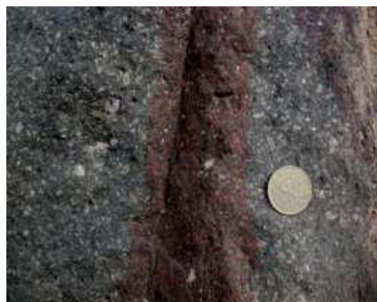
شکل ۴: دگرسانی اکسید آهن

برای بررسی تأثیر منطقه معدنی متروکه مس چغندر سر بر آلودگی خاک منطقه، سه ایستگاه نمونه برداری برای خاک و گیاه شامل: محل بالادست منطقه معدن کاری متروکه (شاهد)، منطقه معدن کاری متروکه و پائین دست منطقه معدن کاری متروکه انتخاب شد. مناطق نمونه- برداری بر روی نقشه زمین‌شناسی منطقه در شکل ۵ نشان داده شده است. همچنین با هدف ارزیابی تأثیر حضور کانسار مس بر تجمع فلزات سنگین در گونه‌های گیاهی بومی منطقه، با توجه به تراکم و تاج پوشش و فراوانی گونه‌ها، پنج گونه گیاهی شامل اسپند، درمنه دشتی، افدرا، قیچ و کاروانکش برای بررسی انتخاب شد. برای تهیه نمونه‌های گیاه، ۱۵ نمونه در هر منطقه و از هر گونه گیاهی پنج نمونه برداشت شد. اندام‌های هوایی و زمینی نمونه‌های گیاهی پس از برداشت و شستشوی کامل با آب معمولی و سپس با آب مقطر، تفکیک شدند. نمونه‌ها به مدت ۷۲ ساعت در آون با دمای ۷۰ درجه سانتی‌گراد خشک و نمونه‌ها به تفکیک اندام هوایی و زمینی به قطعات ریزتر تقسیم و در دستگاه آسیاب خرد شدند. پس از آسیاب هر نمونه، برای کاهش خطا، قطعات داخلی آسیاب که در تماس با نمونه بوده با آب و سپس الکل صنعتی شسته و خشک شد. نمونه‌ها برای آنالیز با دستگاه جذب اتمی به آزمایشگاه شیمی دامغان برای تعیین غلظت عناصر فرستاده شد. فلزات سنگین شامل مس، سرب، روی، نیکل و منگنز با توجه به غلظت آن‌ها در خاک، نحوه تغییرات و توزیع در خاک منطقه و تحقیقات پیشین صورت پذیرفته در ارتباط با ارزیابی تأثیر حضور کانسار مس بر غلظت عناصر سنگین در خاک و گیاه، برای ارزیابی‌های آتی در این تحقیق، انتخاب شد.